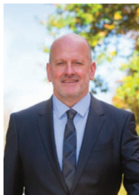
Eric HENRY, Président du Syndicat des Médecins Libéraux (SML)

Le plus important pour nous est de reconnaître la place de tous les acteurs de santé : le fonctionnement de la santé est devenu complexe au fil du temps et nous constatons que bien des décisions sont prises sans concertation avec les parties prenantes. Nous demandons donc aux candidats de travailler en concertation avec toutes les parties prenantes pour la refonte du système de santé que nous préconisons ainsi que pour toute décision stratégique qui pourrait avoir des conséquences sur son fonctionnement.