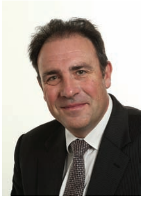
Stéphane REGNAULT, Président du Syndicat National de l'Industrie des Technologies Médicales (SNITEM)